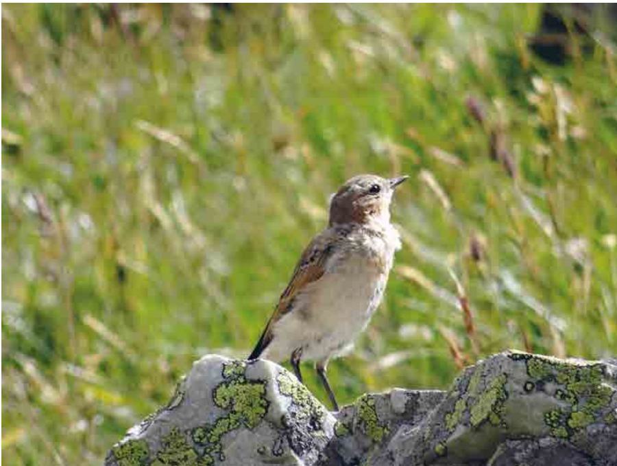
— Zijn voortbestaan ligt in onze handen

schap. Die domeinen waren de klassieke toegangspoorten voor de kerk om het over de zorg voor de schepping te hebben. In lijn met de traditie en zijn voorgangers brengt Franciscus ook het theologische denken over ecologie binnen. De klimaatverandering kan niet enkel aangepakt worden met technische, wetenschappelijke, economische en politieke antwoorden. In wezen gaat het immers over onze relatie met onze medemensen, de natuur, onszelf en God. Hoe handelen we en hoe staan we in het leven?